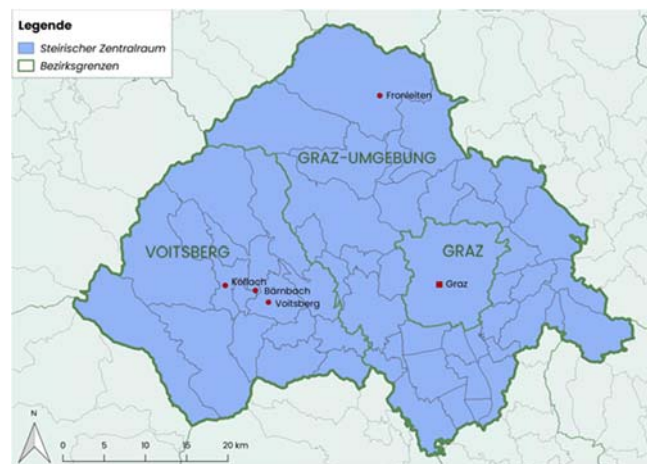
Abbildung 2: Lokalisierung des Steirischen Zentralraums

Der Steirische Zentralraum besteht aus der Stadt Graz und den Bezirken Graz-Umgebung und Voitsberg. Insgesamt umfasst dieser Raum 52 Gemeinden. Obwohl es sich um eine wachsende Region handelt, gibt es in der demographischen Entwicklung ein starkes Stadt-Land-Gefälle. Die Stadt Graz ist eine dynamische Stadt mit mehr als 280.000 Einwohner*innen, einer Vielzahl an universitären und außeruniversitären Forschungseinrichtungen sowie hochrangigen Kultur- und Dienstleistungsangeboten. Sie weist eine hohe wirtschaftliche Dynamik auf und profitiert somit stark von Wanderungszuwächsen. Die Gemeinden des Bezirks Graz Umgebung, insbesondere in der Nähe des Grazer Stadtgebietes, spüren die Effekte der voranschreitenden Suburbanisierung und gewinnen ebenso an Bevölkerung. Der Westen und Norden der Region, darunter auch die ländlichen Gemeinden des Bezirks Voitsberg, sind hingegen durch eine geringere Dynamik gekennzeichnet.