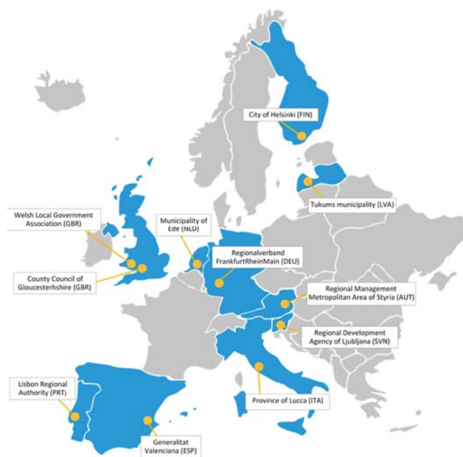
Abbildung 1: Verortung der elf Fallstudienregionen

Die Bundesanstalt für Bergbauernfragen (BABF) bearbeitet gemeinsam mit dem Regionalmanagement Steirischer Zentralraum (RMSZR) das österreichische Living Lab – den Steirischen Zentralraum.